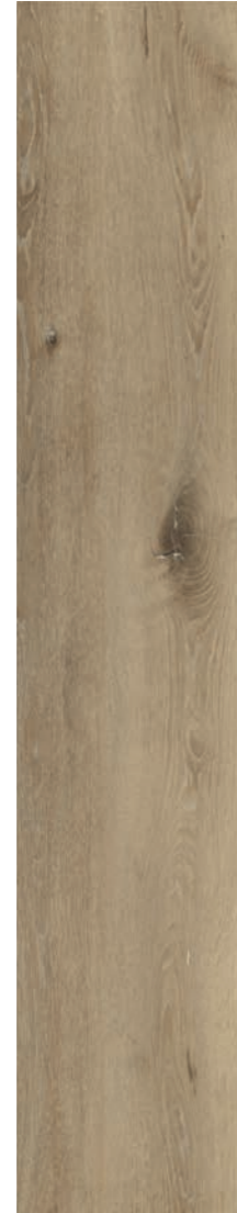
NOCCIOLA 0454003 22,8x122