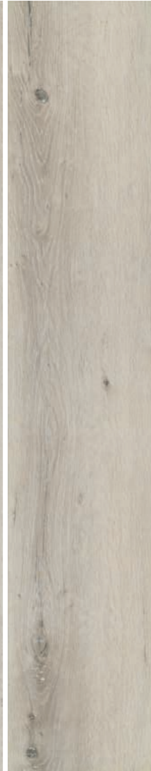
MIELE 0454002 22,8x122