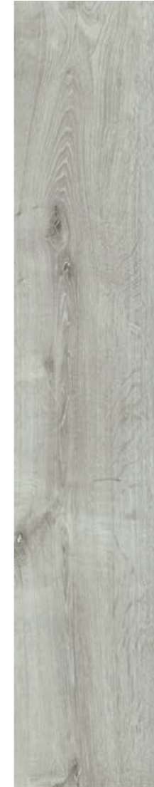
GRIGIO 0454004 22,8x122