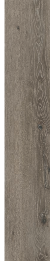
NOCE 0454005 22,8x122